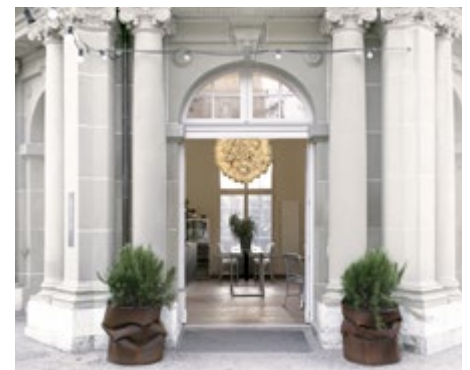
Einstein au Jardin