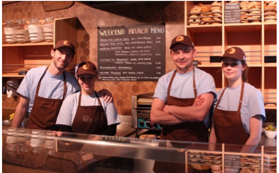
Team Bagelshop Zürich

Die Menschen haben immer mehr Zeitdruck. Gerade in einer Stadt wie Zürich geht es hektisch zu. Sich mittags gesund und schnell zu ernähren, das ist das Dilemma der meisten Arbeitnehmer. Noch vor 10 Jahren war die allgemein verbreitete Wahrheit über Fast Food: Es ist ungesund, unappetitlich und billig und wurde mit fettigen Hamburgern und Pommes Frites gleichgestellt. Heute muss sich Fast Food und gesunde Ernährung nicht mehr ausschliessen. Die Bagelboys achten genau darauf, welche Produkte in das Bagel-Sandwich kommen. Alles was die Bagelboys verkaufen wird von Grund auf selber ge-