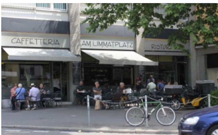
Caffetteria am Limmatplatz

Neben feinem Kaffee, Gipfeli und italienischen Cornetti am Morgen werden den Gästen unterschiedlichen Piadine serviert und am Mittag gibt es ein reichhaltiges Mittagsmenu. Das Menü kann auch mal von der italienischen Küche abweichen, ist aber immer vielfältig und frisch und für jeden Geschmack ist etwas dabei. Die Wünsche und Bedürfnisse der Gäste werden so gut wie möglich berücksichtigt. Und sollten das Menü oder andere Gerichte mal ausgehen, so improvisiert das Team auch gerne, um den Wünschen und den Bedürfnissen der Gäste gerecht zu werden. Wer sich also ein Entrecôte wünscht, darf es gerne in der Küche einbringen. ■