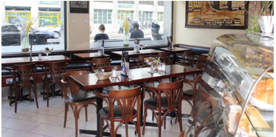
Ein Ort zum Verweilen

Das Café ist im italienischen Stil gehalten und inmitten des hektischen Limmatplatzes lädt die gemütliche «Caffetteria am Limmatplatz» zum Verweilen ein. Das Café bietet eine Art Ruheort, wo man sich in einer ungezwungenen Atmosphäre wie zuhause