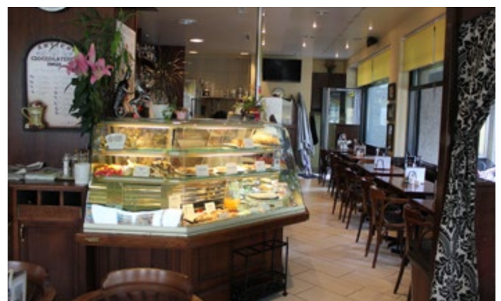
Allerlei italienische Köstlichkeiten