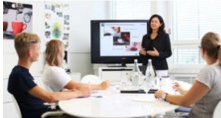
Schulung für sämtliche Themen rund um den Kaffee

Nur wenn Mahlgrad, Kaffeemahlmenge, Anpressdruck sowie Brühdruck, -temperatur und Füllmenge exakt aufeinander abgestimmt sind, fliesst der Kaffee in der gewünschten Qualität in die Tasse. Im Zentrum steht das Naturprodukt. Das heisst: Jede Bohnensorte bringt andere Voraussetzungen mit. Um das Beste raus zu holen, muss die Kaffeemaschine exakt auf die Bohne und ihren Röstgrad abgestimmt sein. Für einen Café crème beispielsweise bedarf es einer gröberen Mahlung als für einen Espresso. Auch die Brühtemperatur beeinflusst den Geschmack. Ist sie zu hoch, wird der Kaffee eher bitter und seine natürliche Säure nimmt ab; ist sie zu nied-