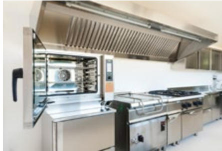
Mit den 10 Geboten zu einer sauberen Küche.

Lebensmitteln trennen Lagern und verarbeiten Sie rohe, nicht genuss fertige Lebensmittel immer getrennt von gekochten, vor produzierten, genussfertigen Lebensmitteln.