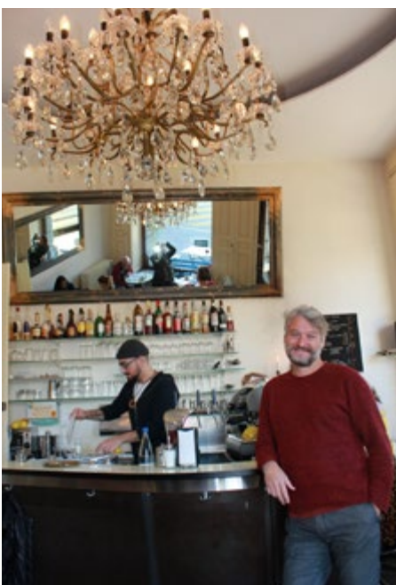
Die geschützte Insel

Das «Parterre» soll ein Treffpunkt sein und bleiben und bietet dementsprechend nur ein kleines Speiseangebot an – das «Gängige» eben. Wem am Mittag ein Hot Panini dennoch nicht ausreicht, kann nebenan in der Crêperie «Le Carrousel» sein Menü zusammenstellen. ■