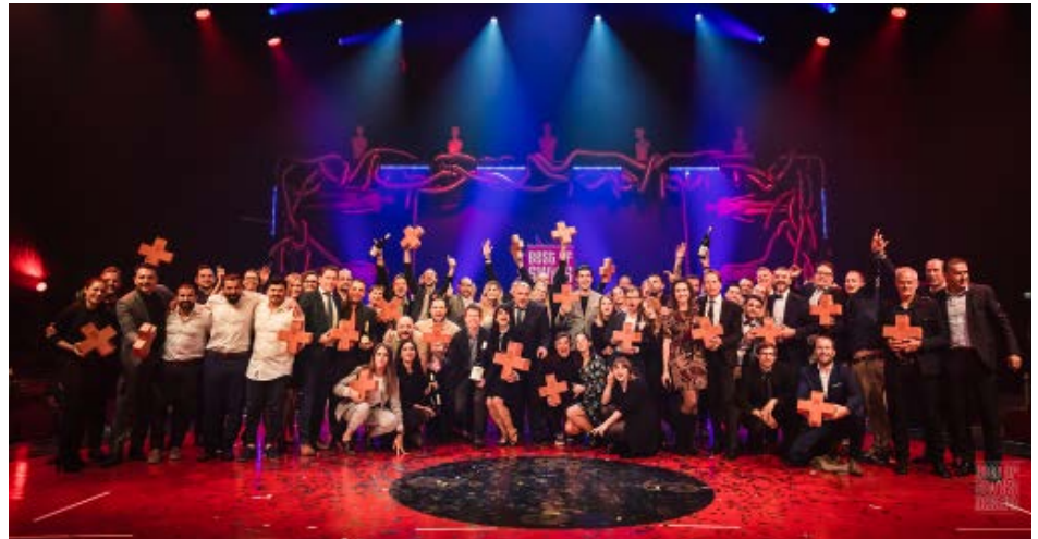
Die Best of Swiss Gastro Awardshow

aus. Nutzen Sie die Chance Ihren Betrieb schweizweit bekannt zu machen. Eine Nomination durch Best of Swiss Gastro und Bewertung durch unsere hochkarätige Jury garantiert Ihnen Aufmerksamkeit für ein ganzes Jahr!