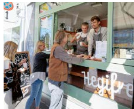
This Schälchli (ganz rechts) betreibt das Hegifret mit viel Herzblut. Am liebsten steht er hinter der Theke und bedient die Kunden.

Der Hegibachplatz ist dank des Hegifrets zu einem lebendigen Treffpunkt geworden. This Schälchli und sein Team ist es gelungen, den einst unscheinbaren Umsteigeort in einen beliebten Quartiertreffpunkt umzuwandeln. Wie das Kafi-Fänschter zum Quartierlieblich wurde und warum es 365 Tage im Jahr geöffnet ist, erzählt der Mitgründer im Interview.