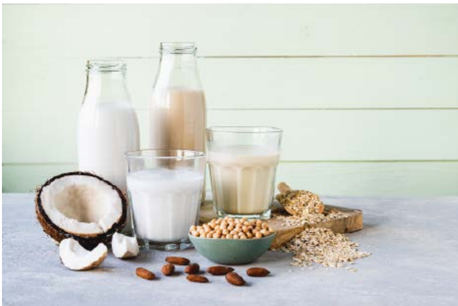
Heutzutage gibt es zahlreiche Milchalternativen.

zen-Getränke im Regal nieder. War der Umsatz vor einigen Jahren noch bei knapp 1% so ist dieser in der Coronazeit schon auf