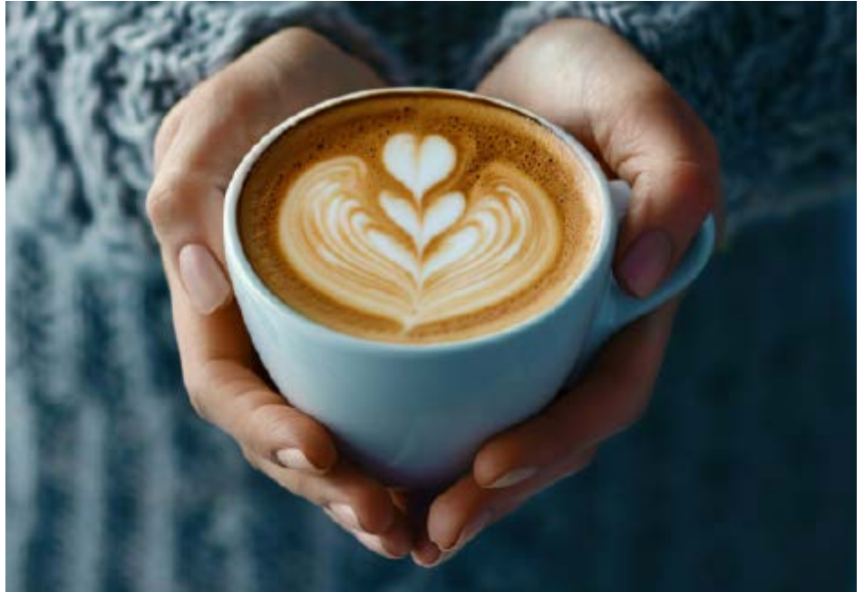
Mit der richtigen Technik kann jede Milch aufgeschäumt werden.

Daher ist es wichtig, das Etikett der Milchalternativen besonders gut im Auge zu behalten. Wo wird produziert? Sind Produkt und Rohstoffe aus dem eigenen Land? Aus der EU? Welche Fette (Öle) werden zugesetzt? Welche Säureregulatoren, Emulgatoren, Stabilisatoren oder sonstige E-Stoffe werden verwendet? Wird Salz hinzugefügt?