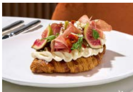
Ein Musterbeispiel für die Handwerkskunst bei Sprüngli: Das Smashed Croissant.

Bei denjenigen, die nach wie vor Bedenken hatten, sei die Sensibilisierung wichtig gewesen. «Da war es wichtig, die Gäste ernst zu nehmen und ihnen zu erklären, was man optimiert hat. Letztendlich ist Vieles jedoch