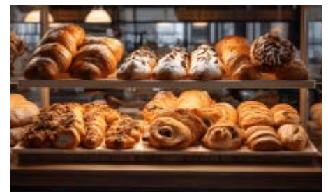
Seit dem 1. Februar gilt bei den Brot- und Feinbackwaren eine neue Deklarationspflicht.

Seit dem 1. Februar 2024 müssen gastgewerbliche Betriebe das Produktionsland von Brot und Feinbackwaren im Offenverkauf schriftlich ausweisen. Für die Umsetzung hatten die Betriebe bis am 31. Januar 2025 Zeit. Betrieben, welche die Brotdeklaration nicht umgesetzt haben, drohen Bussen. ■