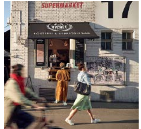
Auch direkt an der Hardbrücke kann man sich seinen VICAFFE holen.

Weil es den Zeitgeist trifft: Qualitativ hochwertig, schnell, unkompliziert – perfekt für den modernen Kaffeegenuss.