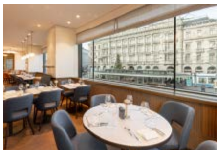
Der Sprüngli erstrahlt seit letztem November in neuem Glanz.

Komplett neu sei auch die Küche: «Es wurde alles herausgerissen und von Grund auf neu gebaut – sehr zur Freude unserer Kü-